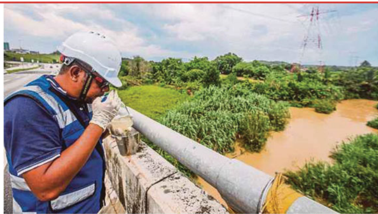
A Pengurusan Air Selangor Sdn Bhd employee conducting a water quality test at Sungai Semenyih in Bangi yesterday.

"Investigations detected a foul smell from a manhole in the vicinity of the residential area in Bandar Bukit Mahkota. It is likely