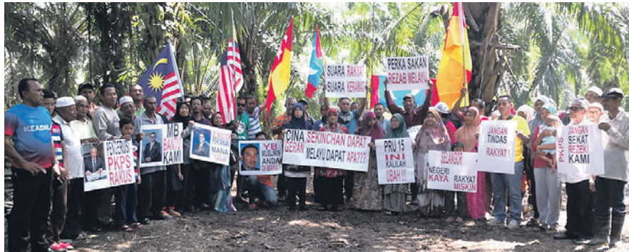
Penduduk berhimpun memohon campur tangan Menteri Besar menangani isu pemilikan tanaman kelapa sawit seluas 240 hektar yang kini diambil alih sebuah anak syarikat kerajaan negeri.