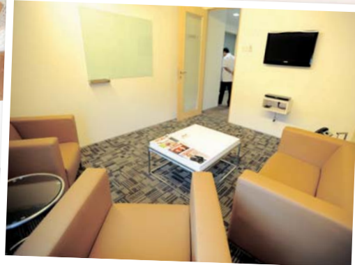
Suasana selesa bagi penyewa untuk mengendalikan urusan kerja.

Kerjasama yang terjalin ini menawarkan pakej yang berbaloi atau value-for-money kepada usahawan menerusi tambahan satu lagi pakej sewaan yang baharu diperkenalkan iaitu Business Address dengan kadar sewaan serendah RM60 sebulan"