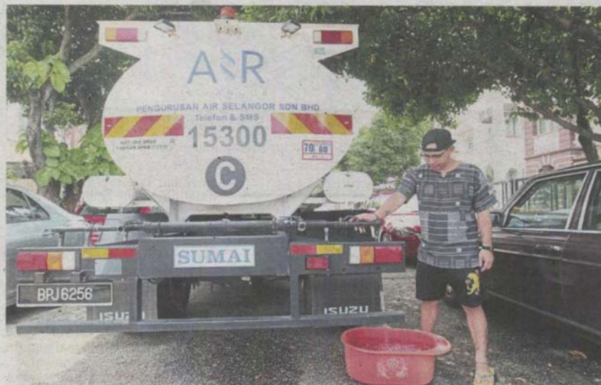
Stocking up: A resident of USJ 11 filling a bucket with water from a water supply lorry.

likely due to the negligence of the company's employees.