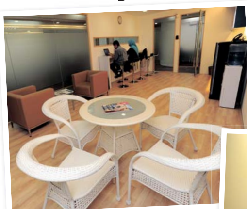
Kemudahan yang inklusif kepada usahawan untuk mempunyai alamat pejabat sendiri, bilik mesyuarat, pengurusan surat menyurat, kawalan keselamatan pejabat selama 24 jam dan kemudahan wifi tanpa had.

Sewaan serendah RM60, Tawaran hebat memulakan perniagaan