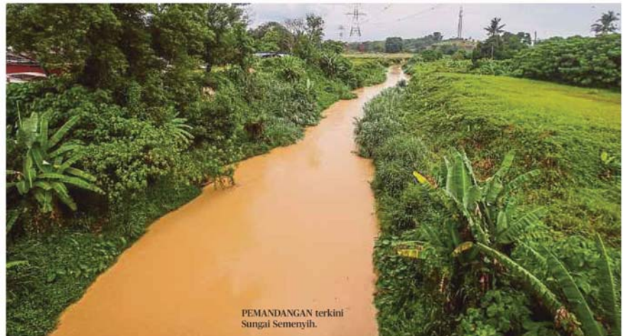
PEMANDANGAN terkini Sungai Semenyih.

Gangguan tidak berjadual itu menyebabkan 204 kawasan membabitkan 372,031 akaun pelanggan berdaftar di wilayah Petaling, Hulu Langat, Kuala Langat dan Sepang terjejas.