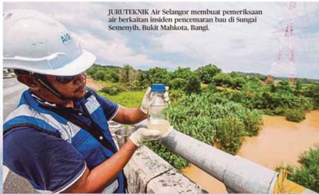
JURUTEKNIK Air Selangor membuat pemeriksaan air berkaitan insiden pencemaran bau di Sungai Semenyih, Bukit Mahkota, Bangi.