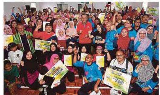
Dr Dzulkefly bersama peserta pada majlis penyampaian Anugerah Jom Nak Sihat Daerah Kuala Selangor, semalam.

"Kementerian berharap isu perkhidmatan kesihatan menjadi antara keutamaan kerajaan. Semua pihak tahu banyak keperluan dan kelengkapan yang tidak mencukupi di hospital seluruh negara. Malah, laporan audit menunjukkan hospital di seluruh negara memerlukan tambahan pelbagai kelengkapan dan peralatan," katanya.